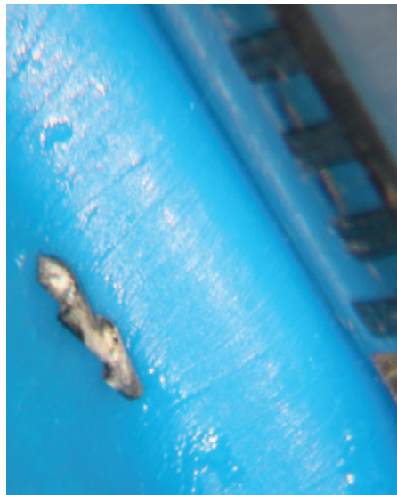
Abb. 1e Der entfernte Feilenrest ist nur 2 mm lang. Das Fragment ist unter der Einwirkung des Ultraschalls erneut frakturiert. Der Entfernungsversuch wurde an diesem Punkt abgebrochen, da das Restfragment jenseits der nach bukkal weisenden Kurve nicht mehr sichtbar war.