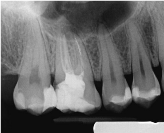
Abb. 5 Zahn 16: Das ca. 4 mm lange Fragment einer Hedströmfeile in der mesio-bukkalen Wurzel liegt am Übergang vom mittleren zum apikalen Kanaldrittel. Es sollte zunächst eine Passage des Fragments versucht werden; wenn dies nicht gelingt, sollte das Fragment mit der Methode von Ruddle entfernt werden. Der dafür notwendige geradlinige Zugang zum Fragment ist erreichbar.