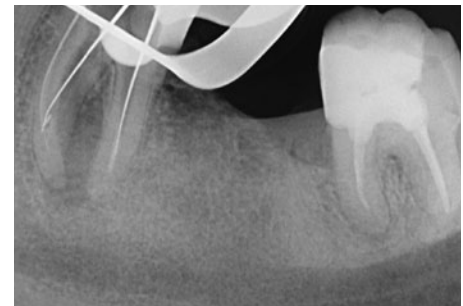
Abb. 1f Im mesio-bukkalen Kanal hat eine Feile die Konfluenz der Kanäle passiert. Der Silberstift im mesio-lingualen Kanal hat den Feilenrest passiert und erreicht ebenfalls die Konfluenz. Damit besteht die Chance, eine vollständige Desinfektion des Kanalsystems zu erreichen.