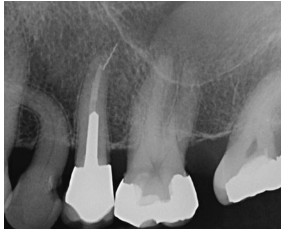
Abb. 2 Zahn 25 wurde 1992 endodontisch behandelt, mit gegossenem Stiftaufbau und VMK-Krone versorgt. Das ca. 3,5 mm lange Fragment eines Lentulo liegt zu einem Drittel im Wurzelkanal, zu zwei Dritteln im periapikalen Gewebe außerhalb des Sinus maxillaris. Der Zahn ist seit 1992 beschwerdefrei. Der Periapex erscheint normal. Weder eine orthograde Revision noch eine WSR sind indiziert.

In einer Folgestudie entfernten Madarati et al. 21 aus verschiedenen Wurzelabschnitten von Eckzähnen ProTaper F5-Instrumente und ermittelten den bei der Entfernung eingetretenen Gewichtsverlust an Dentin. Signifikante Unterschiede zwischen dem apikalen (46,04 mg), dem mittleren (27,7 mg) und dem koronalen Wurzel Drittel (13,5 mg) gingen einher mit ebenso signifikanten Unterschieden in der zur Auslösung einer vertikalen Wurzelfraktur führenden mittleren Kraft von 107,1 N (= 35,5 % der Stabilität der Kontrollgruppe) im apikalen Drittel, 152,6 N (= 50,6 % der Stabilität der Kontrollgruppe) im mittleren Drittel und 283,3 N (= 94,0 % der Stabilität der Kontrollgruppe) im koronalen Drittel.