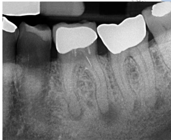
Abb. 4 Zufallsbefund nach negativer Sensibilitätsprobe an einem beschwerdefreien Zahn 36. Eine Parodontitis apicalis liegt an beiden Wurzeln vor. Vor der Überkronung wurde die notwendige endodontische Behandlung nach der Instrumentenfraktur im koronalen Drittel abgebrochen bzw. unterlassen. Das Fragment ist leicht erreichbar und vermutlich einfach zu entfernen.

Fragment fällt nicht signifikant schlechter aus als bei Zähnen ohne Instrumentenfraktur mit 94,5 %, also nur 2,7 % Unterschied. Der Evidenzgrad dieser Studie beträgt Level 3 und wird von keiner anderen Studie übertroffen.