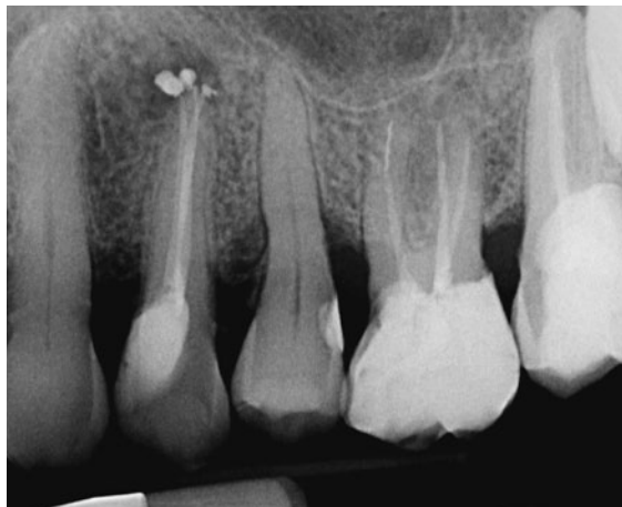
Abb. 3 Zahn 26: Im apikalen Drittel der mesio-bukkalen Wurzel befindet sich seit 15 Jahren ein ca. 4 mm langes Fragment einer Hedströmfeile. Über der palatinalen Wurzel ist eine Transluzenz sichtbar. Daraus ergibt sich die Indikation zur orthograden Revision der Wurzelkanalbehandlung. Über den wahrscheinlich vorhandenen zweiten Kanal in der mesio-bukkalen Wurzel sollte eine Passage des Fragments versucht werden. Eine orthograde Entfernung des Fragments erscheint möglich, würde jedoch die Wahrscheinlichkeit einer Wurzellängsfraktur stark erhöhen und somit die Langzeitprognose eher verschlechtern als verbessern.