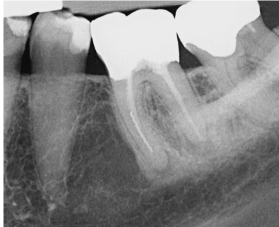
Abb. 6 Zahn 36 wurde 1995 endodontisch behandelt und überkront. Eine Parodontitis apicalis liegt an beiden Wurzeln vor. Ein ca. 6 mm langes Fragment einer Hedströmfeile liegt im mittleren und apikalen Drittel der mesialen Wurzel. Die Spitze ist ca. 3 mm vom Apex entfernt. Die orthograde Revision ist indiziert, dabei sollte das Fragment entfernt werden.