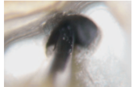
Abb. 1c Entgegen dem Uhrzeigersinn umkreist die feine Ultraschallspitze das Fragment, um es loszudrehen.